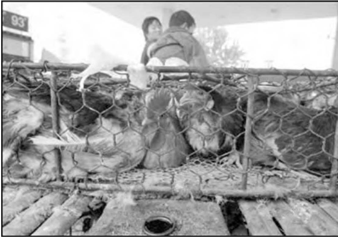
Un kunukero chines ta transporta su yiu den un truck yen di galiña.

D J A K A R T A — E Organizacion Mundial di Salu (OMS) a confirma ayera cu otro dos persona a muri pa e grip aviaria na Indonesia, naunda ya e cantidad di morto pa e enfermedad ta shete, y cuatro di esnan infecta pa e